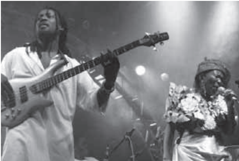
Energie und Pesie: Eyuphuro